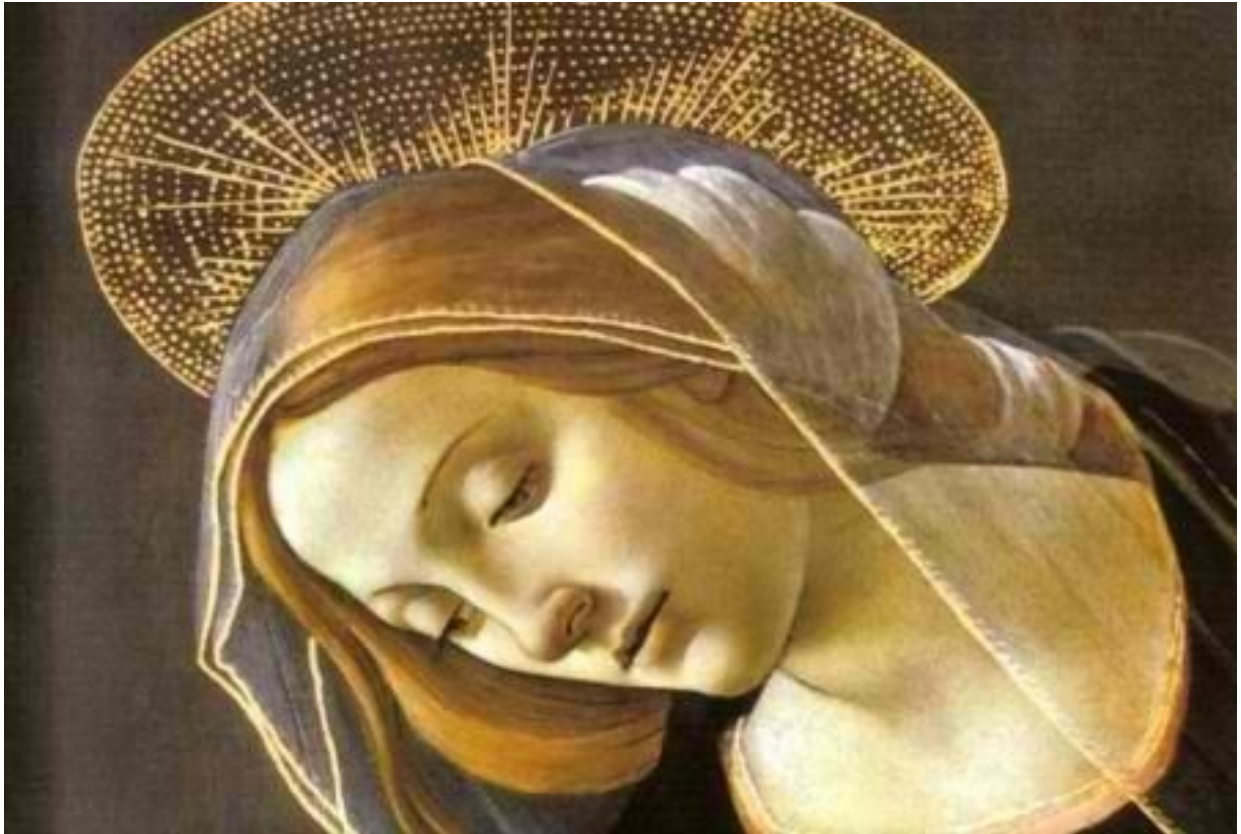
Botticelli Détail de la Vierge Marie