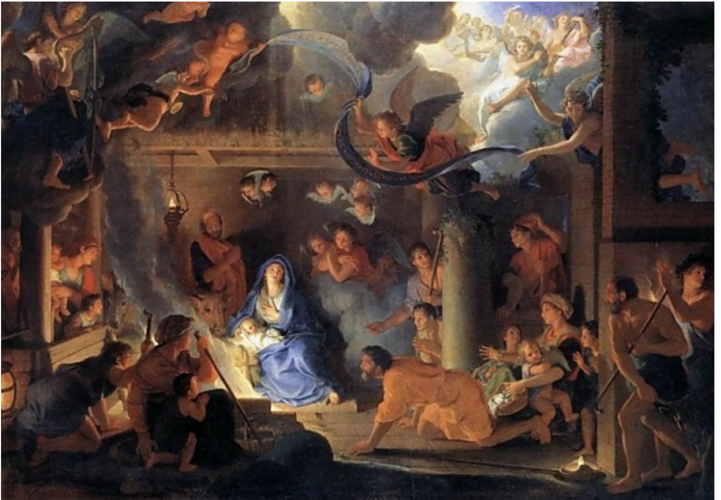
Charles le Brun (1619 - 1690) La Nativité du Christ.