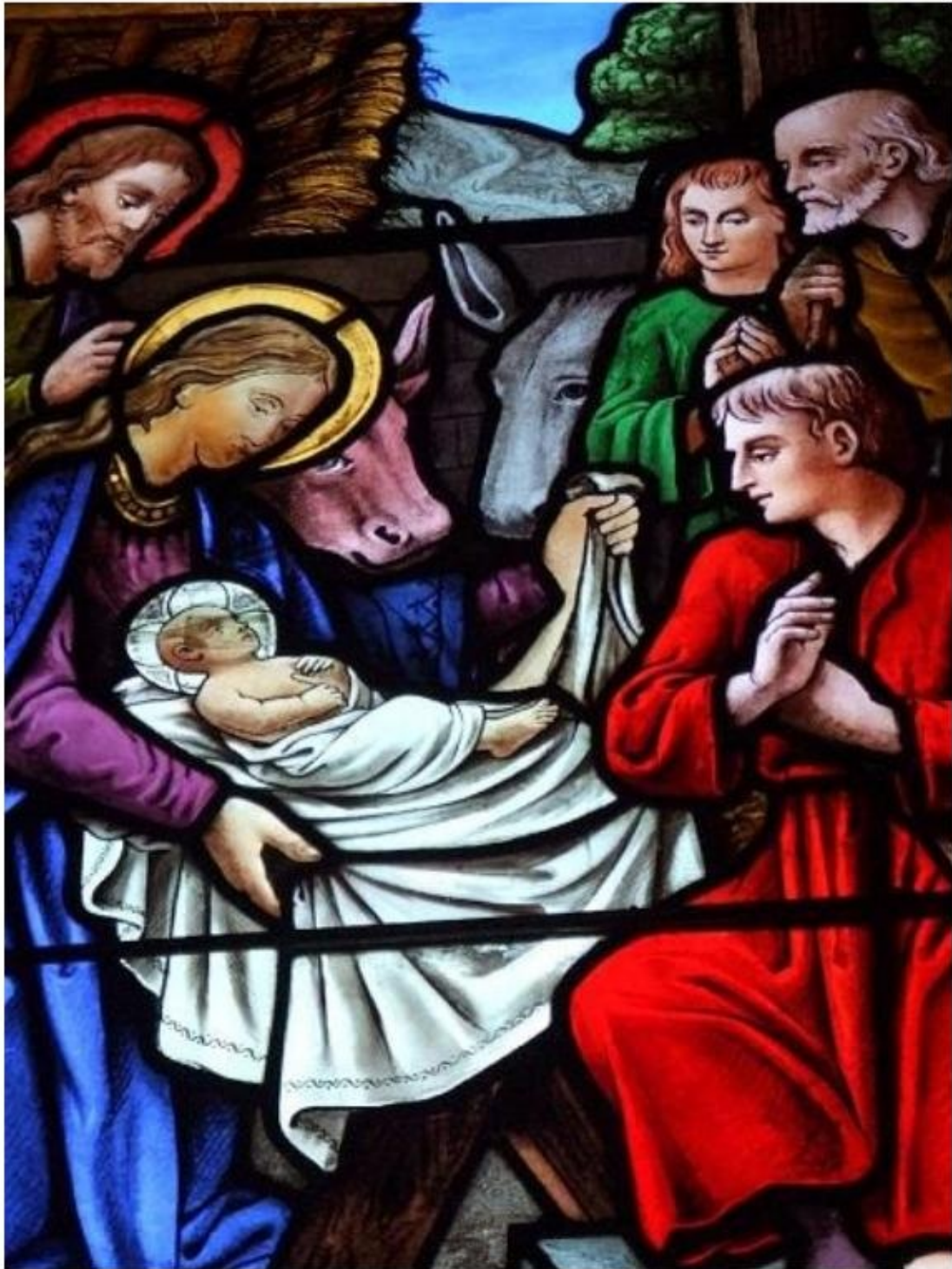
Vitrail de la nativité