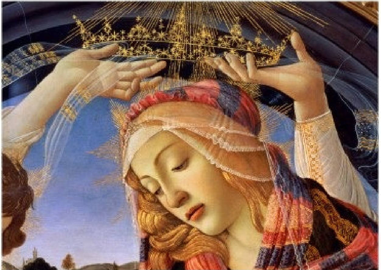
Sandro Botticelli La Madonne du Magnificat